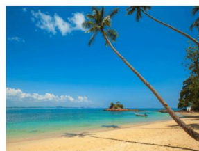
Solo arenoso em uma praia.