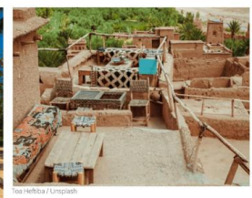
Solo argiloso usado para construção.